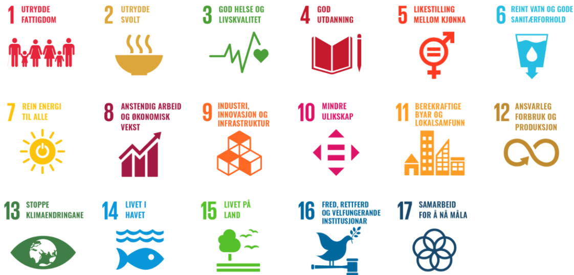
Figur 3: FN-berekraftsmål

Når ein jobbar med berekraftsmåla er det viktig å hugse på at dei tre berekraftsdimensjonane - miljømessig, sosial og økonomisk berekraft - ikkje utan vidare kan sidestillast. Ein mykje brukt modell viser berekraft som ein pyramide, der miljø og klima dannar sjølve grunnlaget for å kunne oppnå ei berekraftig samfunnsutvikling og økonomi. Berekraftsmål 17 «Samarbeid for å nå måla» står difor sentralt i berekraftsarbeidet.