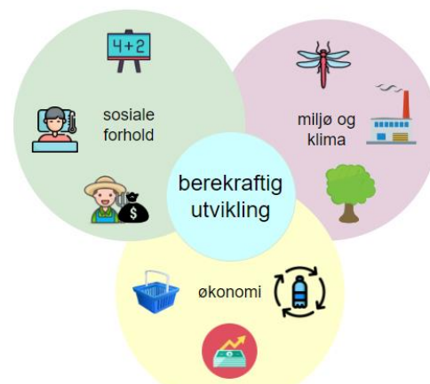
Figur 2: Dei tre dimensjonane i bærekraftig utvikling

Berekraft handlar ikkje berre om miljø. For å oppnå bærekraftig utvikling må det vere ei balanse mellom det miljømessige, sosiale forhold og det økonomiske. Det blir då også snakka om miljømessig, sosial og økonomisk berekraft.