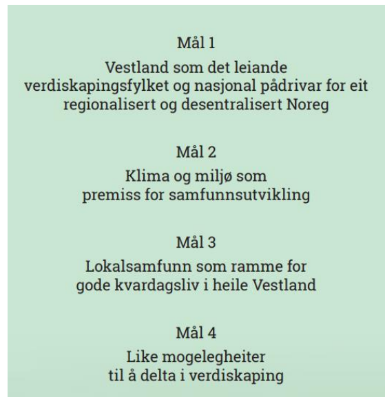
Figur 5: Hovudmåla i regional planstrategi for Vestland 2020-2024

Fylkeskommunen jobbar no med regional planstrategi 2024-2028 og har sendt ut eit høyringsutkast med noko reviderte hovudmål og 10 strategiar for å nå måla. Dersom fylkeskommunen held framdriftsplanen for arbeidet, blir den nye regionale planstrategien vedteken litt før Vik sin kommunale planstrategi. Men det blir mest truleg så seint i kommunen sin planprosess at den nye regionale planstrategien fyrst kan leggjast til grunn når sjølve samfunnsdelen til kommuneplanen blir utarbeidd.